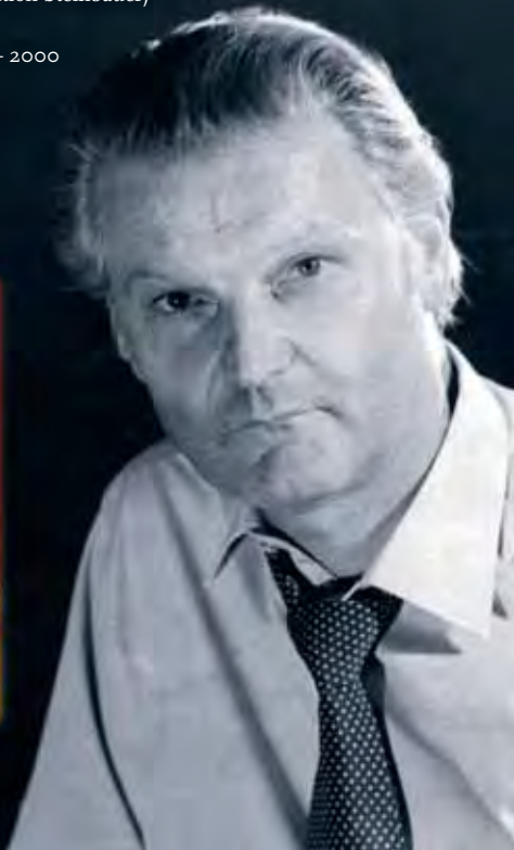
Prof. Karl Grell (5. September 1925 – 6. September 2003)